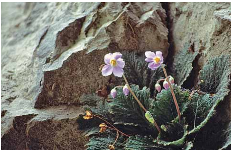
Flora alpina en Añisclo

gran potencial turístico que tenemos, desde la Comarca de Sobrarbe se apuesta por la diversificación y desestacionalización de la actividad productiva basada en el aprovechamiento de los recursos agroganaderos y forestales y por desarrollar un turismo de calidad.