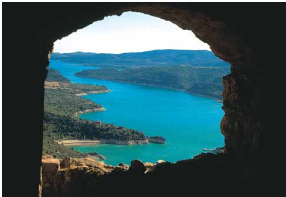
Imagen del embalse de El Grado tomada desde el despoblado de Clamosa

La naturaleza ha sido como en ningún otro sitio la forjadora de una comarca enclavada en lo más agreste y duro del Pirineo, las imponentes montañas del norte rivalizan con la aspereza de los intrincados desfiladeros de la sierra de Guara por el sur. Ambas moles rocosas dejan entre medio un espacio surcado por manojos de ríos que van a parar al más importante de los cursos pirenaicos: el Cinca, verdadero eje de intercambio de ideas, gentes y recursos a través de los siglos y que consolidó a esta comarca como un ente territorial natural, más allá de divisiones administrativas más o menos artificiosas.