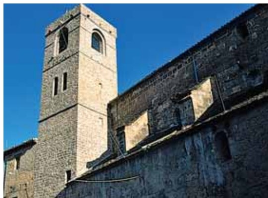
La iglesia de Boltaña es otro de los grandes templos del XVI