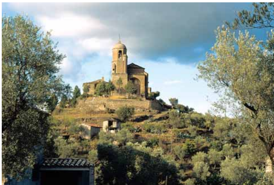
La iglesia de Olsón es el mejor ejemplo de arquitectura religiosa del siglo XVI en Sobrarbe

A finales del siglo XVIII y comienzos del siguiente, se alzan algunas iglesias según esquemas relacionados con los conceptos del neoclasicismo, más cuida-