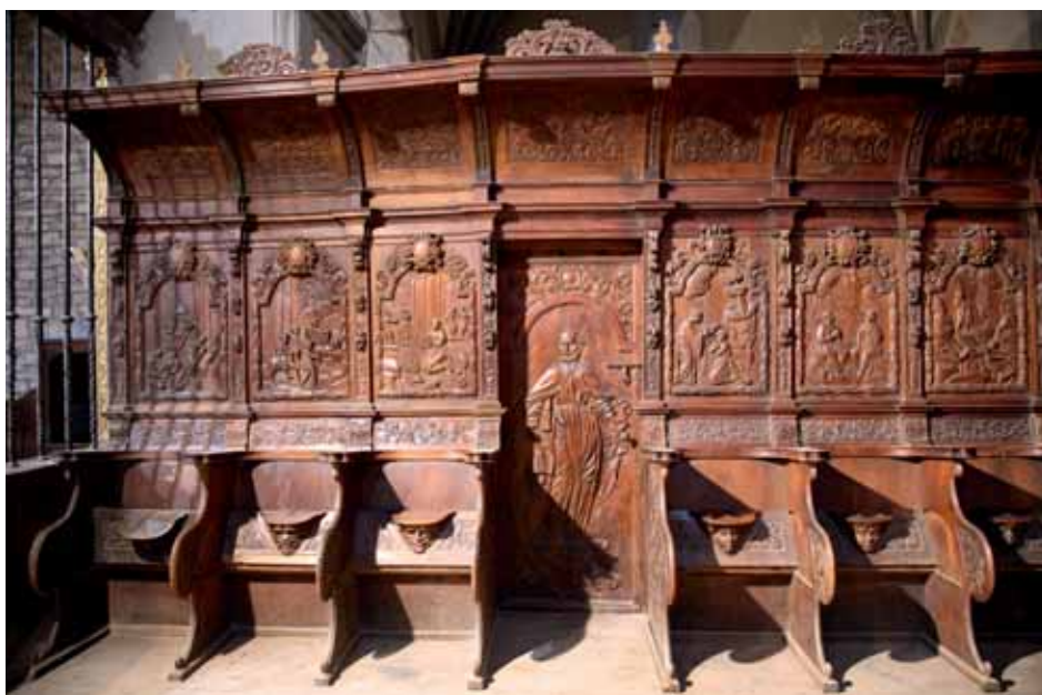
La sillería del coro del monasterio de San Victorián, actualmente en la iglesia de Boltaña, se talló en el siglo XVIII con escenas de la vida de San Benito

simuladas, predominio del dibujo con trazos gruesos, en negro, una sensación de relieve basada en contrastes de colores, con una reducida gama de colores. Los motivos más frecuentes son floreros y símbolos religiosos, con representación del « Agnus Dei », el Cáliz eucarístico, ángeles portando símbolos marianos o de la Pasión de Cristo. Una pintura de carácter escenográfico, de lo cual era clara muestra las desaparecidas pinturas del ábside de la iglesia de San Vicente de Labuerda (1774), con una finalidad didáctica, con un amplio conjunto de símbolos, como podemos observar en las pinturas de Burgase. Destaca este conjunto, así como el de Muro de Roda y San Hipólito de Castejón de Sobrarbe. Las formas decorativas se prolongan hasta principios del siglo XIX (Ceresa, 1804, y Vio, 1814).