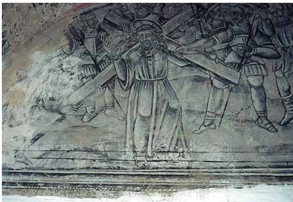
Pintura mural representando a Cristo camino del calvario en la capilla de Casa Mur de Aluján

iglesia francesa de Saint Mercurial de Vielle-Louron, en el Valle del Louron. Dicha relación con Francia parece reflejarse también en las pinturas murales aparecidas en el ábside de la iglesia de San Esteban de Sin.