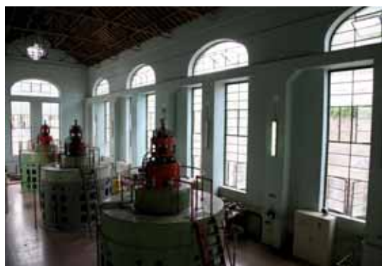
Central hidroeléctrica de Lafortunada

Pero la no construcción del embalse de Jánovas, y del complejo a él asociado, no impidió la realización de obras complementarias: túnel de derivación en los 80, pistas de acceso y ataguía (para desviar las aguas del Ara por el túnel) en los 90. Esta última obra fue derribada por el empuje de las aguas en el invierno de 1997. Tampoco se evitó la expropiación forzosa de la población, en una de las