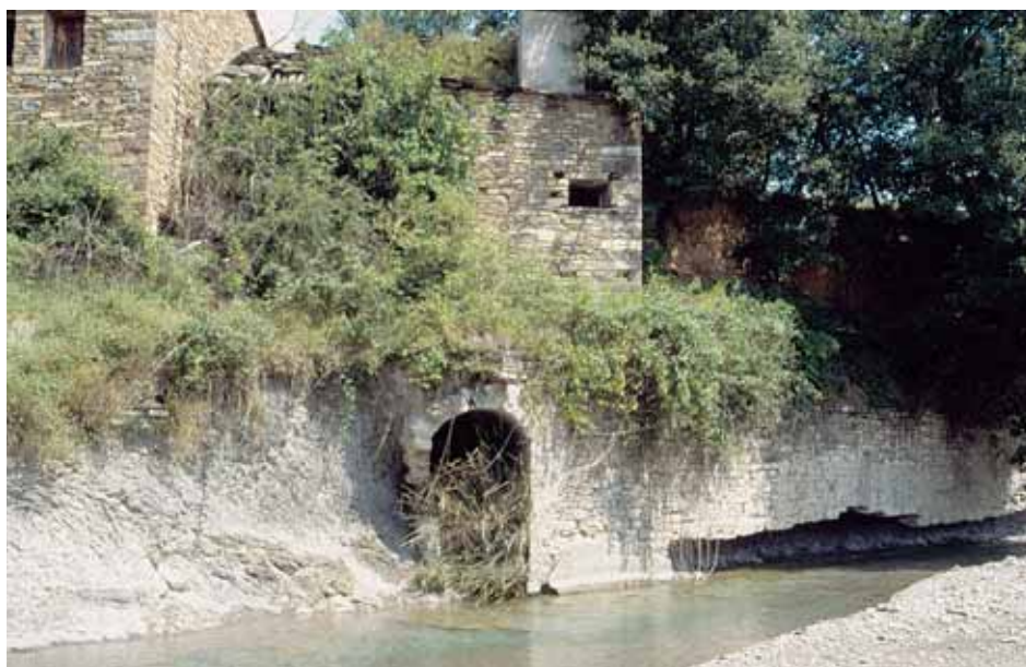
Molino en La Nata