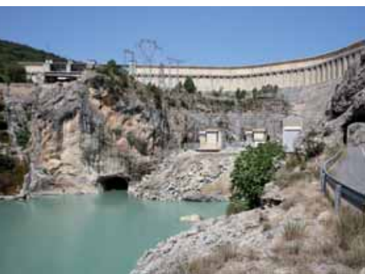
Presa de Mediano

con sus tierras, pueblos e historia bajo las aguas.