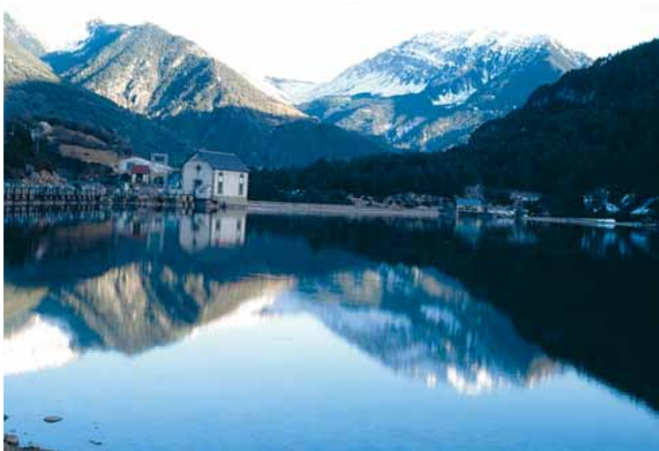
Embalse de Pineta

La Sociedad Hidroeléctrica Ibérica, tras ampliaciones y fusiones empresariales, pasó a constituir la mayor compañía eléctrica española, Iberduero SA, tras la Guerra Civil; y, años después, Iberdrola SA. En 1993 vendió el patrimonio eléctrico del Alto Cinca a Eléctricas Reunidas de Zaragoza, hoy Endesa, por quince mil millones de pesetas. El patrimonio vendido da idea de las dimensiones ciclópicas del proyecto original: saltos del Cinca, Cinqueta, Barrosa, Urdiceto, Salinas y Laspuña; presas con embalse o azudes de Barrosa, Pineta, Hospital (Parzán), Trigenero, Avellanera, Urdiceto, Salinas y Laspuña en el Alto Cinca y Plandescún en el Cinqueta; centrales hidroeléctricas de Barrosa, Urdiceto, Bielsa, Salinas, Lafortunada y Laspuña; ibones –lagos de alta montaña– represados de Marboré, Sein, Millar Alto y Millar Bajo; conducciones imponentes por más de 38 km; red de pistas y caminos en 20 km; tramos carreteros y puente; 6 estaciones de aforo y una veintena larga de edificios, incluyendo el casino y la iglesia de Lafortunada, que posteriormente se cederían al ayuntamiento de Tella-Sin. Además de las redes de distribución eléctrica de alta, media y baja tensión en varias provincias y otras concesiones hidráulicas para usos industriales en el río Ara.